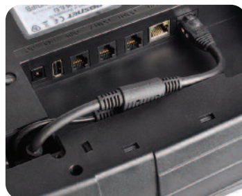
Funkcjonalne złącza komunikacyjne w tym Ethernet i USB