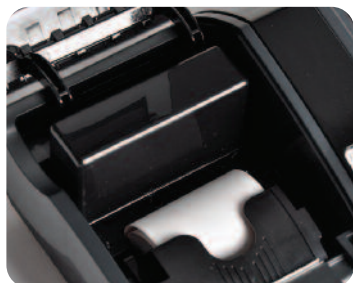
Mechanizm drukujący „easy load” – łatwa wymiana papieru