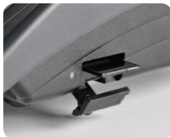
Kopia elektroniczna – wygoda i oszczędność